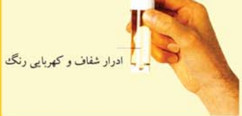
ادرار شفاف و کهربایی رنگ

ظاهر ادرار در شرایط مختلف تغییر می‌کند. رنگ ادرار صبح‌ها تیره‌تر از بقیه مواقع روز است. تغییرات موقتی رنگ ادرار ممکن است به خاطر برخی غذاها (مثل چغندر) و داروها باشد. با وجود این، تغییر رنگ ادرار می‌تواند نشانه‌ای از بیماری هم باشد. ادرار بسیار تیره ممکن است نشانه بیماری کبدی و ادرار قرمز یا کدر ممکن است نشانه‌ای از خونریزی یا عفونت مثانه یا کلیه باشد. در صورتی که مطمئن نیستید که تغییر ظاهر ادرار طبیعی است یا خیر، به پزشک خود مراجعه کنید.